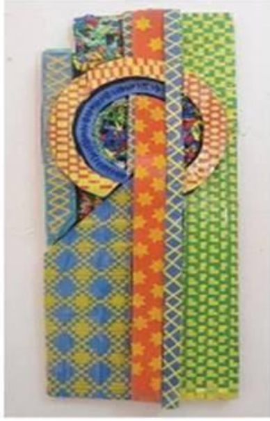
عمل (٢٦) الطالبة هبة عادل برغوث