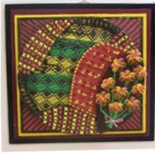
عمل (٢) الطالبة سارة حسن الجيار