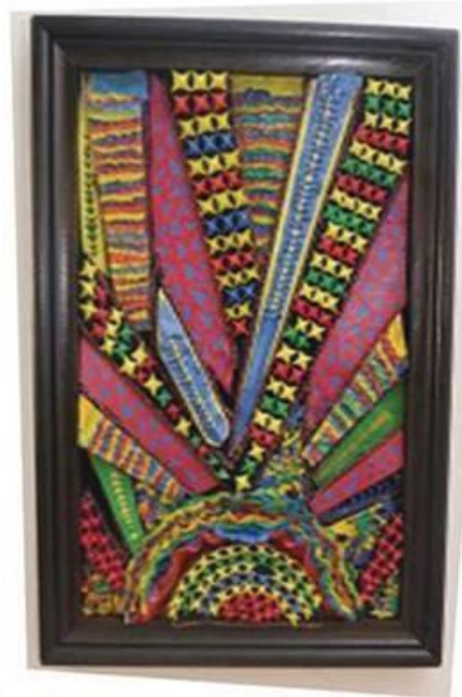
عمل (٣) الطالبة دينا سمير خليل