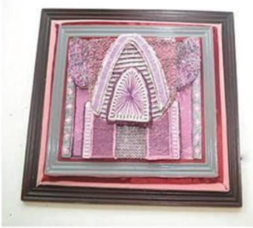
عمل (٨) الطالبة عزيزة رضا السكري