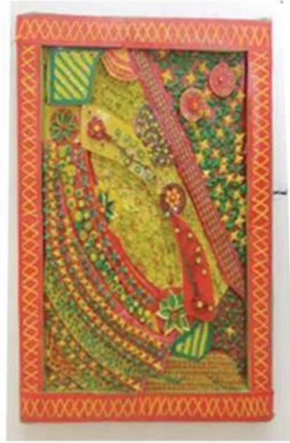
عمل (٢٩) الطالبة نورا خالد الشامى