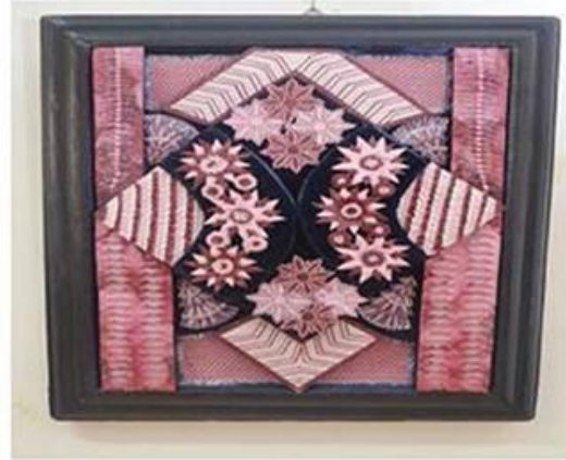
عمل (٧) الطالبة نجلاء فتحى شاهين