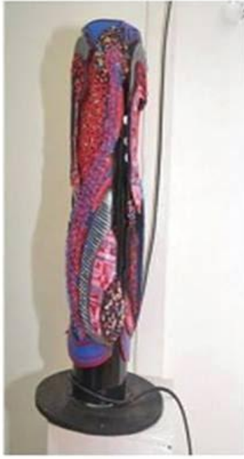
عمل (١٠) الطالب شريف عرفة انور