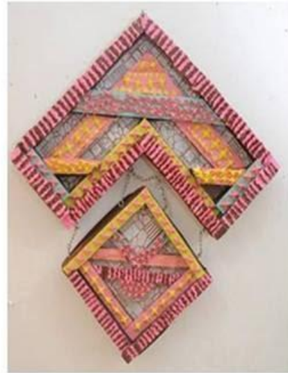
عمل (١٥) الطالبة نهال اشرف السليقوسي