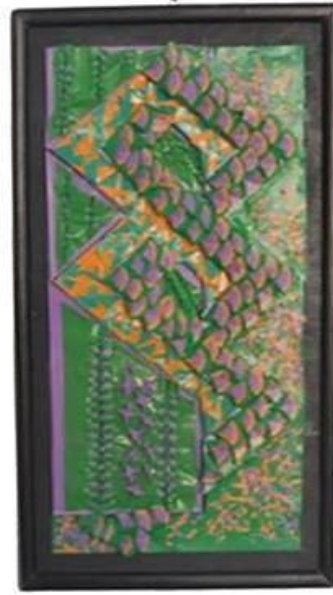
عمل (٤٣) الطالبة اسماء صبحي الصعيدي