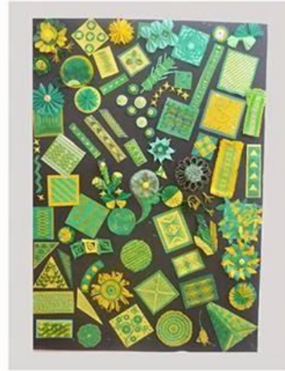
معالجات تشكيلية متنوعة للخامة من إعداد الباحثة