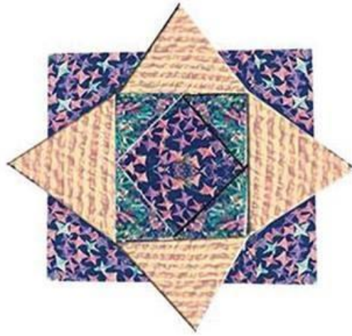
عمل (٤٧) الطالبة علياء السيد الاحمدى