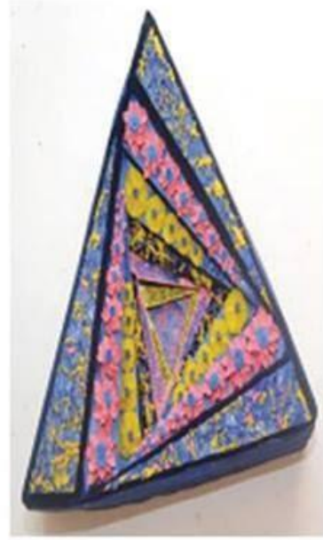
عمل (٢٥) الطالبة فاطمة سعيد ربيع