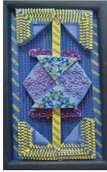
عمل (٩) الطالبة خلود خالد