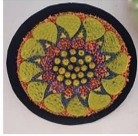
عمل (٥) الطالبة شيما ابراهيم البطل