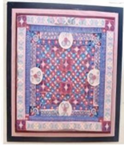
عمل (٢٧) الطالبة اسماء بدر