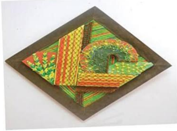
عمل (١٤) الطالبة يماني بهجت صديق