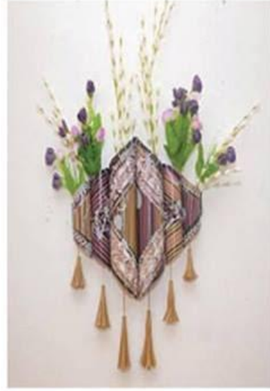
عمل (٣٣) الطالبة اسماء سعيد يونس